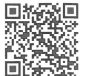
↑ やしま幼稚園 Instagram