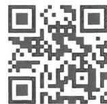
↑ やしま幼稚園 ホームページ

高松市屋島西町2477番地4 認定こども園 やしま幼稚園 TEL: 087-843-2241 FAX: 087-843-2243 URL: http://yashima-youchien.com