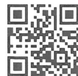
↑ 公開保育 申し込み